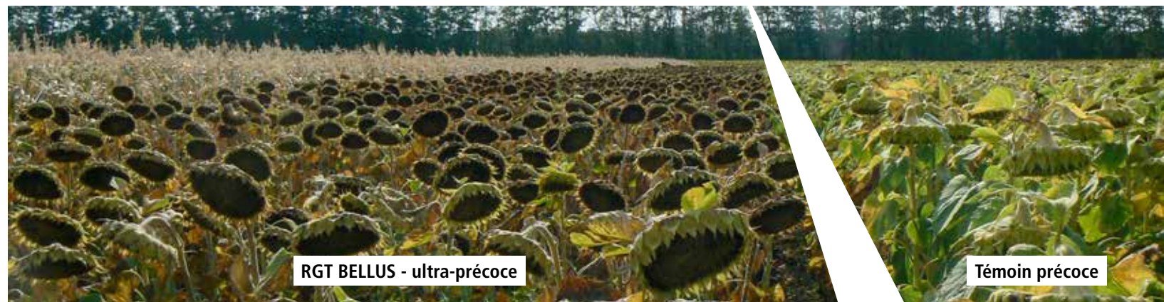
RGT BELLUS - ultra-précoce