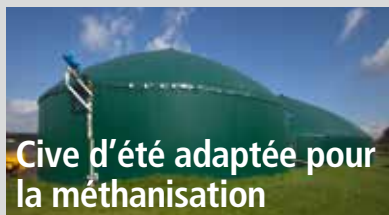
Cive d'été adaptée pour la méthanisation