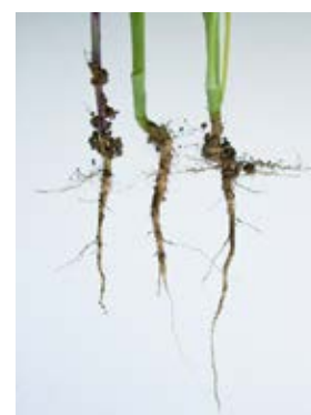
Système racinaire A gauche : moutarde blanche A droite : RGT CAPPUCCHINO

La moutarde RGT CAPPUCCHINO est à conseiller dans tous les assolements (sauf betteravier). Elle est très adaptée pour des semis précoces et des rotations courtes.